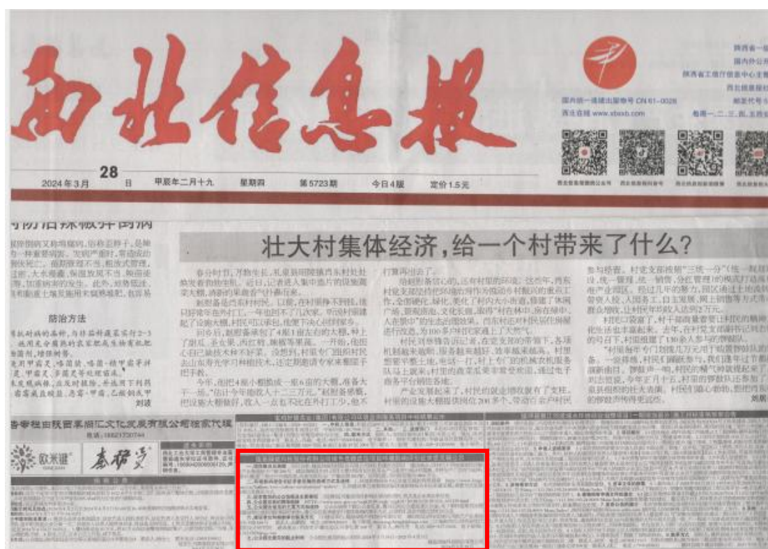
图 3-3 第二次信息公示报纸截图（第二次刊登）