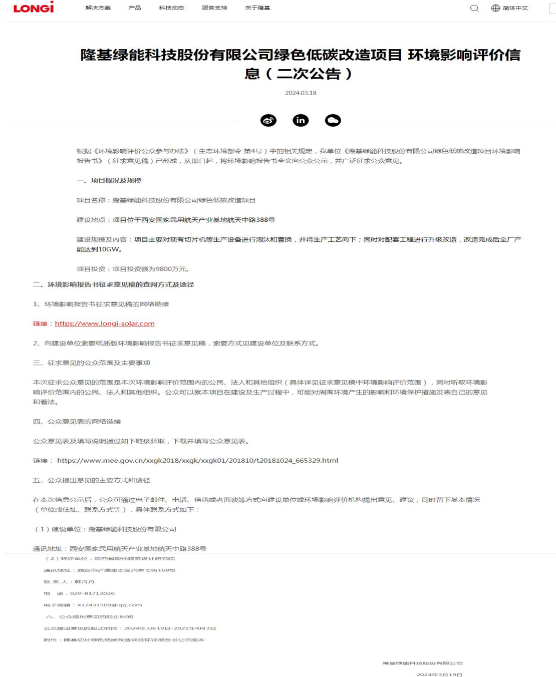
图 3-1 第二次信息公示网站截图

项目环评报告征求意见稿完成后在隆基绿能科技股份有限公司网站进行了征求意见稿公示，公示时间 2024 年 3 月 19 日-2024 年 4 月 3 日，公示网址为： https://www.longi.com/cn/bulletin/low-carbon-environment-notice/ 。公示截图详见图 3-1。