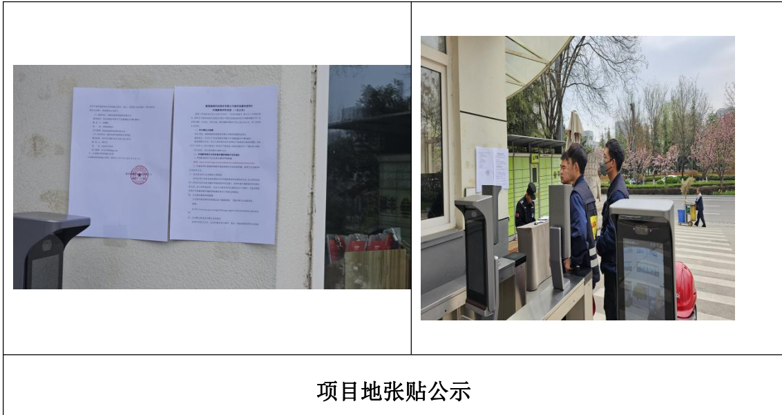
图 3-4 第二次现场张贴公示

我公司于 2024 年 3 月 19 日在项目所在地进行了现场张贴公示，张贴时间为 10 个工作日，详见图 3-4。